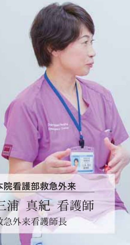
本院看護部救急外来