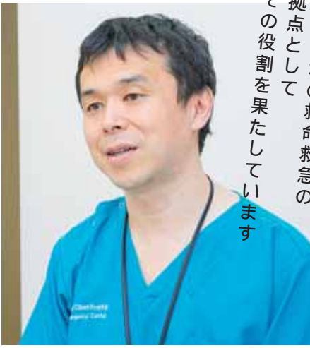
宮城県北の救命救急の拠点としてその役割を果たしています

の救命救急センターは、24時間検査や画像診断、血管内治療ができる、県北では少ない医療施設です。全科オンコール体制（緊急呼び出しができる体制）で、必要な時には各診療科専門医からのバックアップも受けることもあります。」と大崎市民病院の特出すべき救急体制を話します。今秋からはドクターヘリの受け入れも始まり、果たすべき役割はますます広がりを見せています。