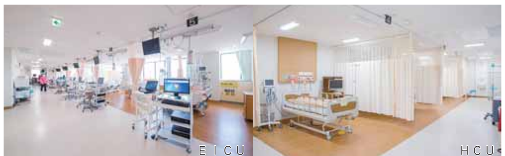
E I C U