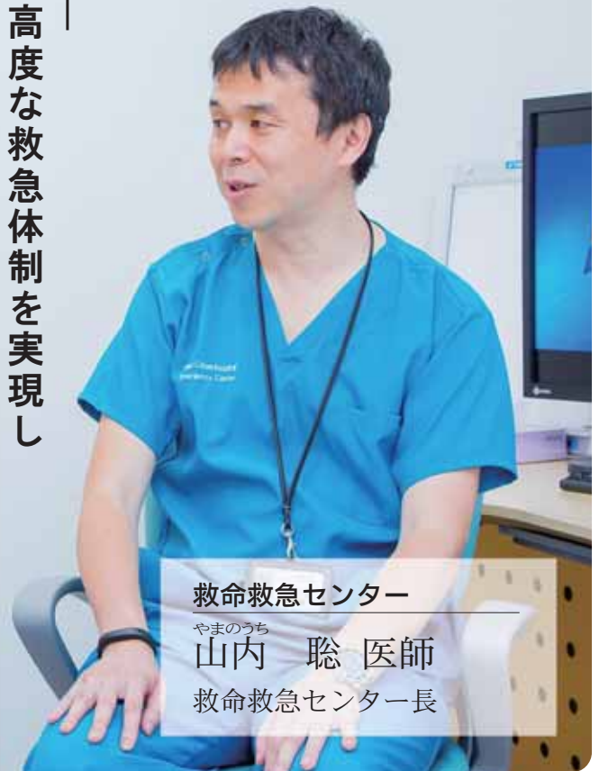
救命救急センター